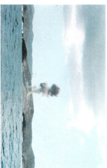
Destruyendo Municiones Sin Detonar

En 1975, cesó el lanzamiento de bombas aéreas y de superficie sobre la Península de Flamenco y los cayos circundantes. A pesar de que la península ha sido rastreada para detectar las MSD, aun existe una cantidad substancial de MSD peligrosas en las áreas usadas previamente cómo blancos.