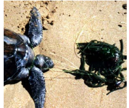
Cría de peje blanco enredada en artes de pesca.