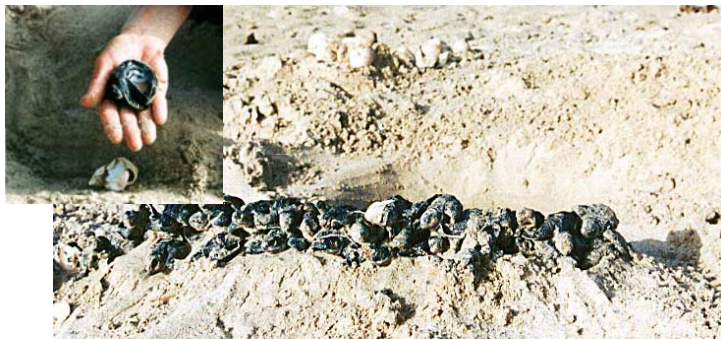
Tinglitos incinerado en la playa Zoni.

AMENAZA: Las fogatas en las playas de anidaje han incinerado los neonatos de las tortugas.