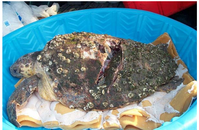
Un cabezón (caguama) muerto por un bote.