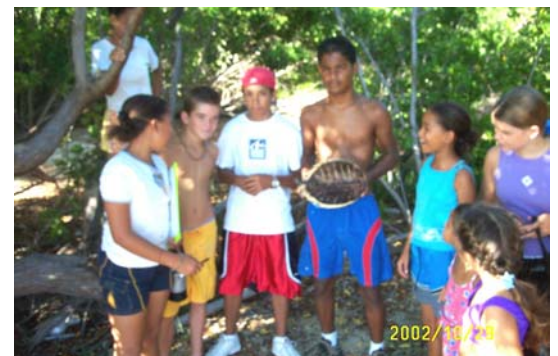
2002/10/11 Los niños y niñas culebrenses se sienten apenados al encontrar un carapacho de carey joven.

del patrimonio natural de Culebra. Hay que informar a la gente que estas prácticas son ilegales. No se debe comprar productos relacionados con las tortugas como artículos hechos de los carapachos, la carne, el aceite o los huevos. Se debe avisar de la pesca ilegal al 787-724-5700. Habrá recompensa si el caso resulta en una convicción.