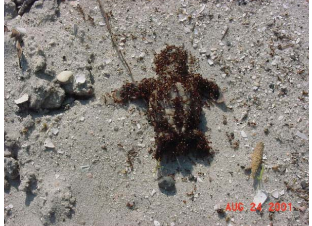
Las hormigas bravas devoran las crías.

SOLUCIÓN: Se debe navegar a un paso lento y responsable en las aguas costeras de Culebra.